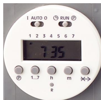
Programma & tijd-display

Externe schakelaar t.b.v. Airsaver. Voor model G1 en G2, uitgevoerd met 5 meter kabel.