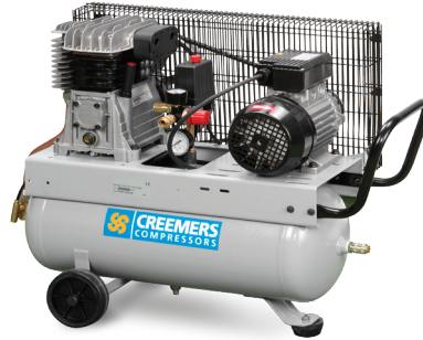
MOBIEEL 254/25 - MOBIEEL 254/50 - MOBIEEL 254/90