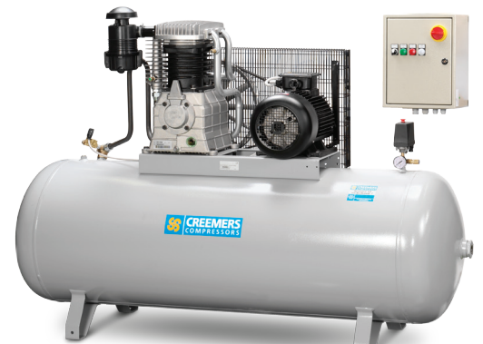
EC 827/500 en EC 1210/500