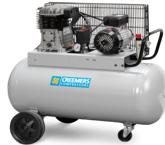
MOBIEEL 387/50 - MOBIEEL 387/90 - Mobiel 387/200 - EC 514/200